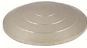
Rainuré- Alu incolore Réf 4391