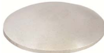
Lisse- Alu brut Réf 4395