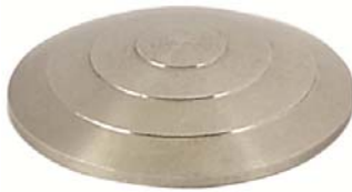
Rainuré- Inox Réf 4396