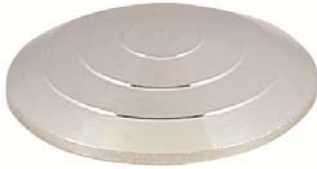
Rainuré- Alu brut Réf 4390