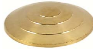
Rainuré- Laiton Réf 4392