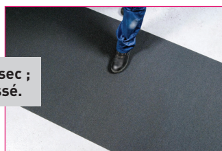
Noir 1000 mm

! A coller sur support sec ; dépoussiéré, dégraissé.